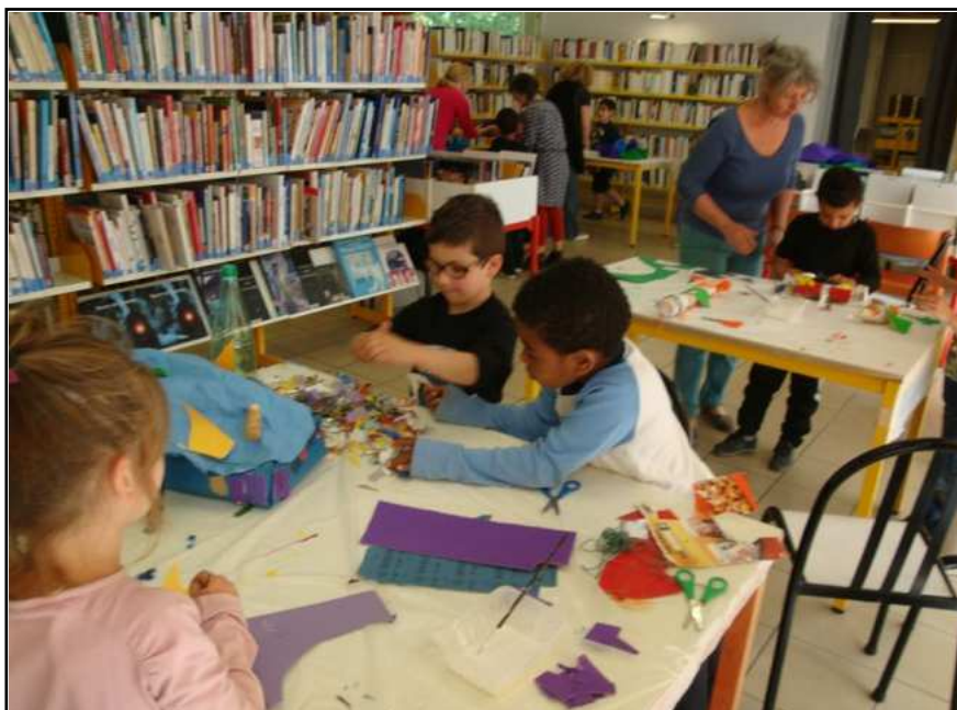
Atelier du 22 mai après-midi, classe de maternelle grande section