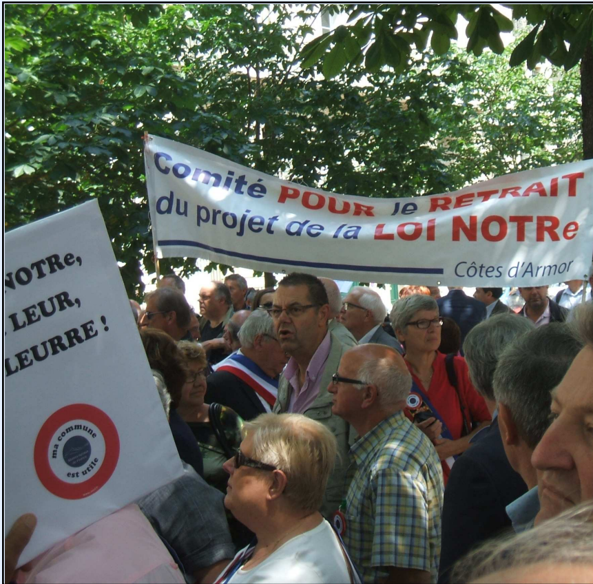
Les maires ruraux se sont rassemblés devant l'Assemblée nationale pour défendre la ruralité et refuser la liquidation des communes