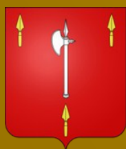
Mairie de Cendras

En espérant vous retrouver nombreux lors de ces différents moments de rencontre, la municipalité vous souhaite un très agréable été 2017 !