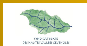
SYNDICAT MIXTE DES HAUTES VALLEES CEVENOLES