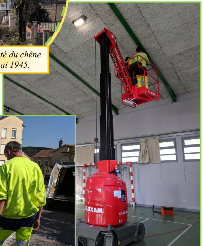
Remplacement des lampes halogène 500w à la salle polyvalente par des lampes à Led 150w.