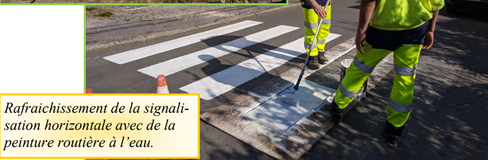
Rafraîchissement de la signalisation horizontale avec de la peinture routière à l'eau.