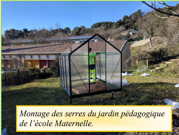
Montage des serres du jardin pédagogique de l'école Maternelle.