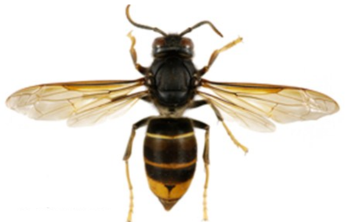
Frelon Asiatique Vespa Velutina

Pour plus d'information, consultez le site www.frelonasiatique.mnhn.fr dédié à la question du frelon asiatique et géré par le Muséum National d'Histoire Naturelle.