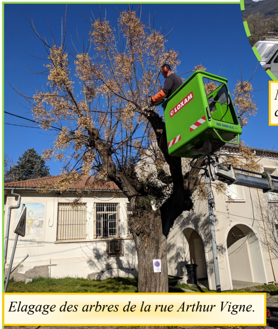
Elagage des arbres de la rue Arthur Vigne.