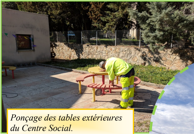
Ponçage des tables extérieures du Centre Social.