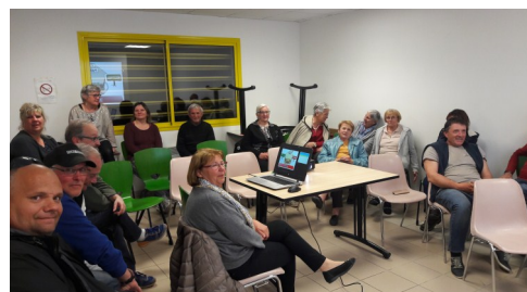
Réunion publique préparatoire au budget 2019