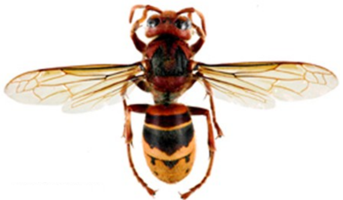
Frelon Européen Vespa Crabro