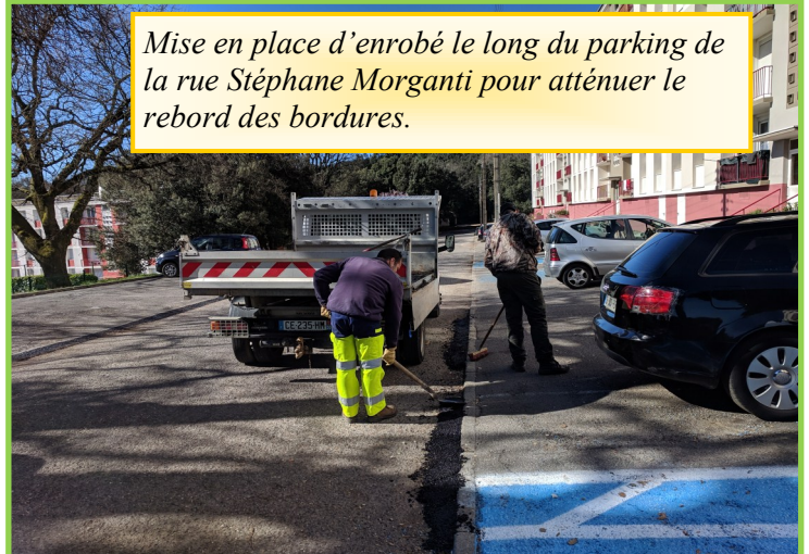
Mise en place d'enrobé le long du parking de la rue Stéphane Morganti pour atténuer le rebord des bordures.