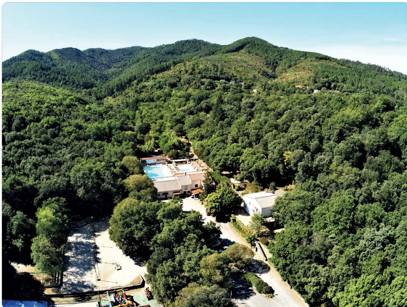
Le camping La Croix Clémentine vu du ciel.

qui avaient toujours des bonnes adresses à conseiller aux vacanciers. Nous avons souvent atteint le millier de clients simultanément au pic de l'été.